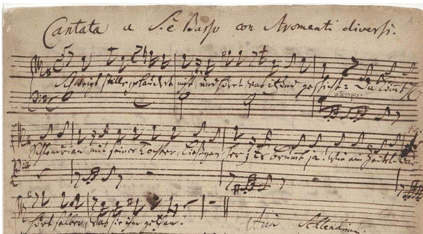
Autograf pierwszej strony Kantaty o kawie Jana Saebastiana Bacha